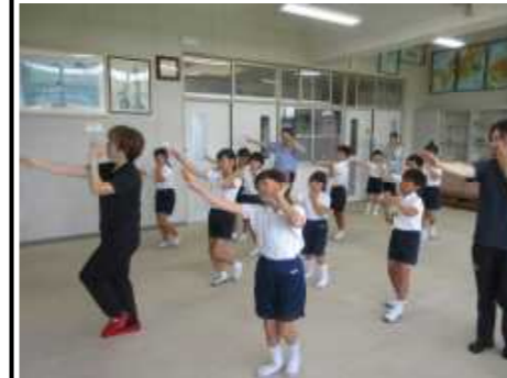
<7/12 イシシハカマ踊り練習>